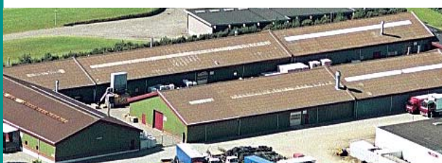
Industrivej 44 Bramming Danmark