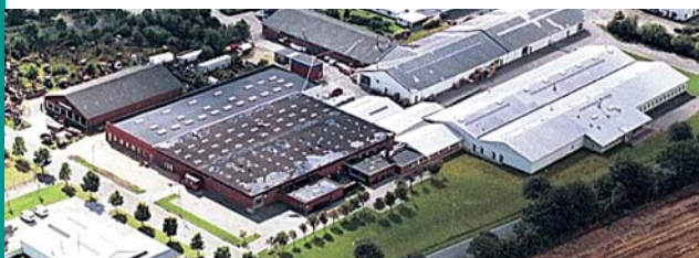
Vardevej 9 Bramming Danmark