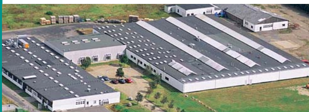
Vardevej 4 Bramming Danmark