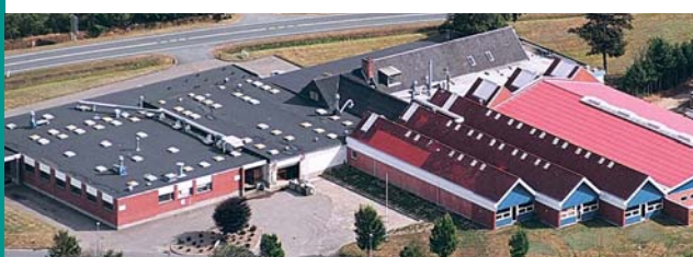
Vardevej 17 Bramming Danmark