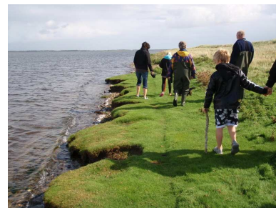
Nissum Fjord Dagen 2009 - Fjand Ø