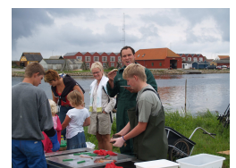
Folk kommer hvis der er mange aktiviteter samlet på et sted.