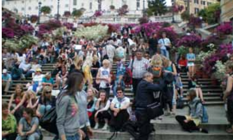
Den Spanske Trappe