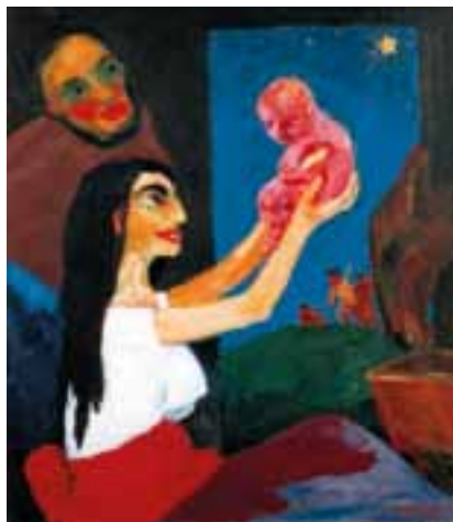
Emil Nolde, Julenat, 1912.

fin klaverkoncert med en engelsk koncertpianist, mens der en anden aften var arrangeret en anderledes og - for nogle - grænseoverskridende aktivitet, nemlig folkedans. Når man så medtager, at der ud over den alsidige åndelige føde var sørget særdeles godt for os fra køkkenets side, må man sige: det var en dejlig uge, og vi er mange, der allerede nu glæder os til næste år, hvor der efter den foreløbige plan vil blive lejlighed til at besøge Vallekilde Højskole en uge i juni måned.