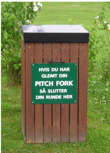
1. hul på Tange Sø