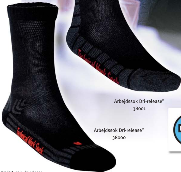
Arbejdssok Dri-release® 38001

Kvalitet: 82% dri-release ( 85% bomuld - 15% andre fibre ) 7% polyamid - 6% lycra - 5% elasthan