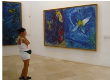
Chagall-museet i Nice

Please, bitte, por favor, s'il vous plaît, si placet! Bonjour, buenos días, guten Tag, hello, salve!