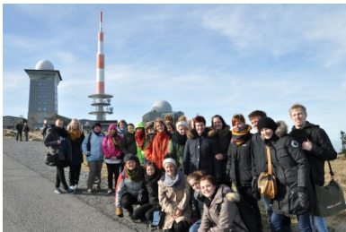
På udveksling i Aschersleben

Latin: Romerrigets sprog, ophav til alle romanske sprog. Grundmodel for sprogtilegnelse.