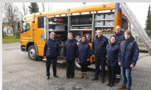
Fra besøget hos Beredskabsstyrelsen i Hedehusene