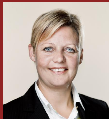
Ordfører for Landdistrikterne og øerne