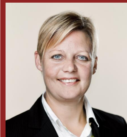
Ordfører for Landdistrikterne og øerne