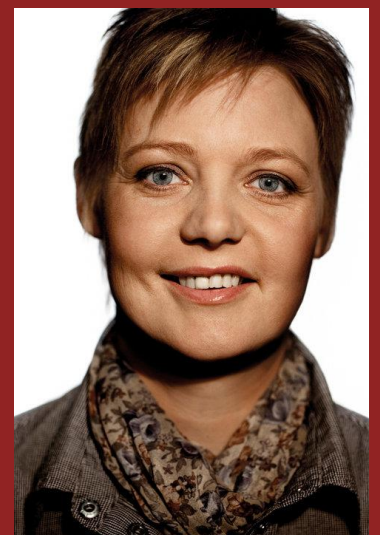
Ordfører for Landdistrikterne og Øerne

Udvalget for Landdistrikter og Øer har været på deres sin første indenlandske studietur. Destinationen var Bornholm. Her var der sammensat et tætpakket program. Bornholm står overfor en masse af de kendte udfordringer, der er som landdistrikt forstærket af at være en ø. Besøget startede med et stort debatmøde, der blev transmitteret direkte på TV2 Bornholm.