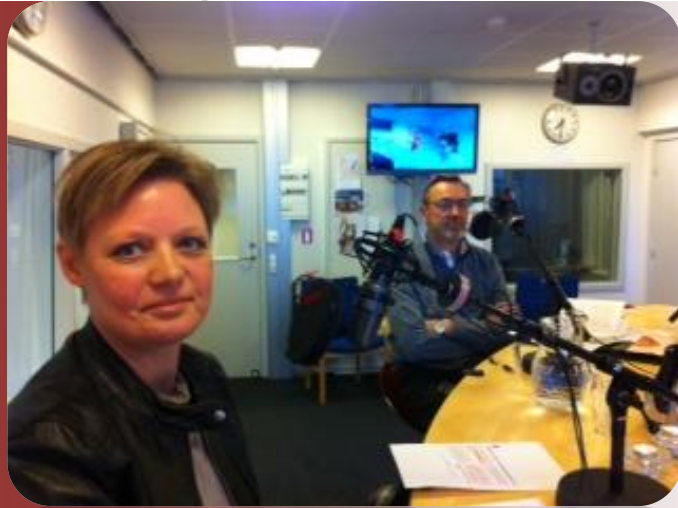
Radioudsendelse på P4, hvor jeg d. 8. marts debatterede ligestilling