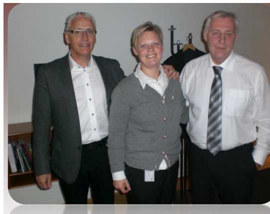
HC Østerby, Transportministeren og jeg efter, at aftalen om den nye motorvej faldt på plads.

Vi skaber ikke vækst og nye arbejdspladser ved at sidde på hænderne. Derfor har socialdemokraterne med næste års finanslov sikret en vigtig fremrykning af offentlige investeringer for 18,75 mia. kr. i veje, skoler, sygehuse, boliger og miljø. Det vil kickstarte dansk økonomi igen, så vi får skabt vækst og job her og nu. Den tidligere regering efterlader en økonomi, der har det værre end hidtil antaget. Det gør blot en kickstart af økonomien endnu vigtigere og mere aktuel. En kickstart er også fuldt ud økonomisk ansvarlig. Det er nemlig investeringer, som under alle omstændigheder skulle foretages indenfor en årrække. Det fornuftige i at fremrykke disse investeringer til 2012 og 2013 er, at det er nu vi har de ledige hænder i byggebranchen. Kickstarten forventes at skabe 21.000 nye job over de næste to år.