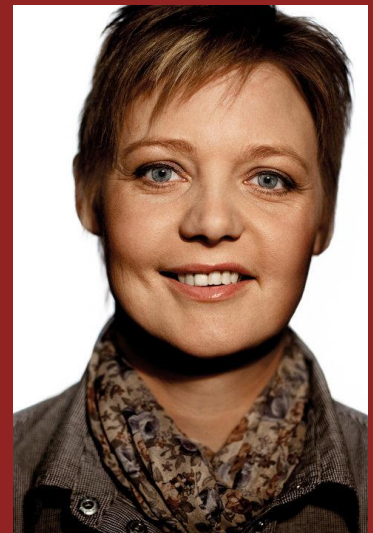
Ny ordfører for Landdistrikterne og Øerne

Tusind tak for en fantastisk valgkamp Ny ordfører for Landdistrikterne og Øerne Ny motorvej og Politihovedkvarter