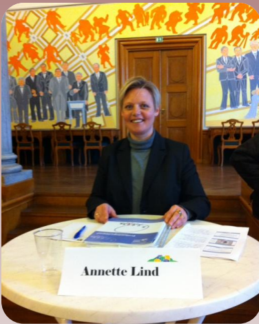
På Landdistrikternes dag deltog jeg i en paneldebat om unges muligheder for job og uddannelse i Landdistrikterne

På landdistriktsudvalgets område har vi afholdt Landdistrikternes dag og diverse høringer. I denne uge har Udvalget for Landdistrikter og Øer afholdt en offentlig høring i Folketinget om erhvervsvirksomhed, udvikling og vækst i landdistrikterne. Formålet med høringen var at få belyst, hvordan man skaber erhvervsvirksomhed, udvikling og vækst i landdistrikterne, og hvilke udfordringer og barrierer der er. Høringen skal danne grundlag for en efterfølgende offentlig debat, som vi opfordrer eksperter, organisationer og andre interesserede til at deltage i.