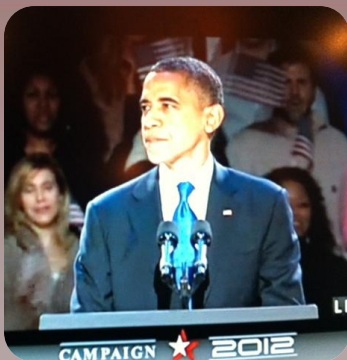
Obama under hans sejrstale