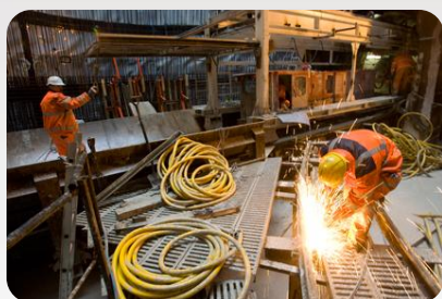
Kort efter lykkedes det os at vedtage aftalen om akutjob. En aftale, som jeg er rigtig stolt over og som er vigtig for hele Nordvestjylland

Et nyt folketingsår er for alvor i gang. Godt nok havde vi først åbning for godt en måned siden, men arbejdet har været i gang siden 1. august. Dagen for åbningen var som sidste år rigtig højtidelig, men med et år i bagagen ser tingene lidt anderledes ud. Dagene flyver af sted. Som oftest bliver de rigtig lange, og bunkerne på skrivebordet bliver sjældent arbejdet helt i bund. Men arbejdet er spændende og udfordrende. I skal ikke være et øjeblik i tvivl om, at jeg kæmper for at sætte Nordvestjylland på det politiske landkort ved hver given lejlighed.