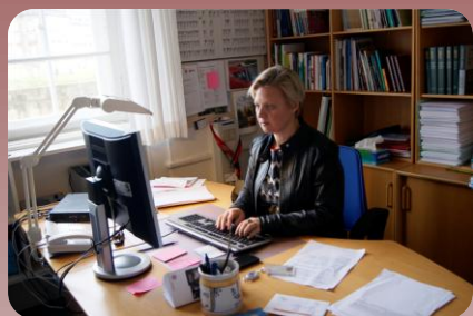
Her ses jeg på mit kontor på Ridebanen

For Socialdemokraterne er det helt afgørende, at vi får løftet indsatsen på området, så vi fremover kan arbejde målrettet for at undgå sager om omsorgssvigtede børn. Derfor har regeringen netop afsat et trecifret millionbeløb til at sikre en langt bedre beskyttelse af udsatte børn.