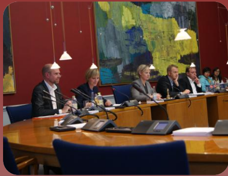
Her ses jeg med miljøminister Ida Auken til et af Udvalget for Landdistrikter og Øers mange åbne samråd