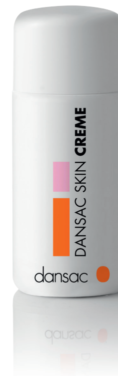
DANSAC SKIN CREME

Dansac Skin Creme fås i flasker á 100 ml.