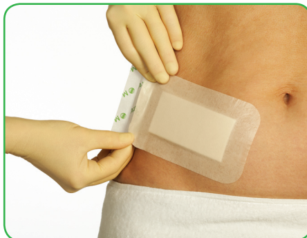
Tag fat i de overlappende dele af beskyttelsespapiret og træk indtil klæbefladerne ses og fiksering kan påbegyndes.