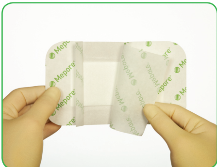
Pakken åbnes og bandagen tages ud.