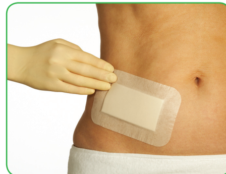
Placer bandagen på huden uden at strække og fjern forsigtigt resten af beskyttelsespapiret. Glat klæbekanten for at sikre optimal hæftning til huden. Bandagen må ikke strækkes under påsætning!