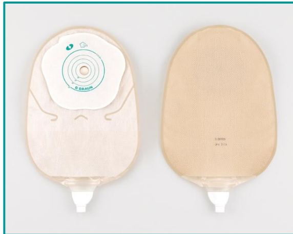
Softima® Uro Silk opklipbar