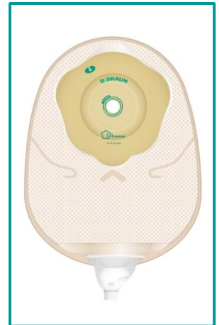
Softima® Uro Silk konveks