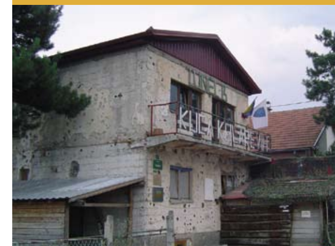
Tunnelmuseet. Fra dette hus blev der under borgerkrigen gravet en 800 m lang tunnel under Sarajevos lufthavn.

betjenten ville se pas og det grønne kort, og da han havde fået forklaret, at campingvognen var det andet køretøj, der var skrevet på kortet, blev vi blot ønsket god tur. Jeg nåede dog lige at spørge, hvordan det var med pengene i landet og fik forklaret, at euro var helt fint. Snart fandt vi ud af at deres lokale valuta kaldes Mark (KM), og kursen er ca. som DM i gamle dage, nemlig ca. 4 Dkr. eller en halv euro. Vejen mod Mostar var fin at køre på, selv om der var mange sving, og det var lidt svært at finde ud af hastighedsbegrænsningerne. Der gik ikke lang tid, før vi fik øje på den første moské med den høje minaret, hvilket mindede os om, at vi var kommet til et land med stor muslimsk befolkning. Efter ca. 12 km's kørsel i landet dukkede der en flot gammel borg op lige ved siden af vejen, og der var en fin parkerings-