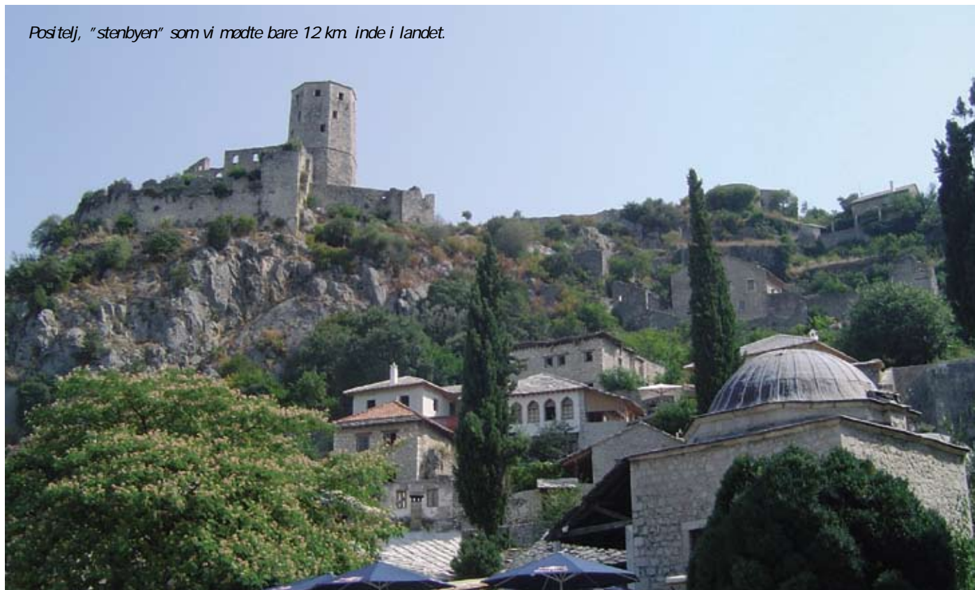
Positelj, "stenbyen" som vi mødte bare 12 km inde i landet.

Det er kun elleve år siden, at tre års total belejring af Sarajevo sluttede, hele landet var i en borgerkrig, der samtidig var en krig for retten til selvstændighed.