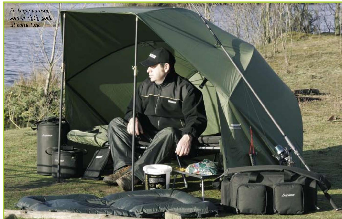
En karp-parasol, som er rigtig godt til korte ture.

Tit og ofte bruger jeg en speciel form for parasol, der hviler på den ene side, så den fungerer som en slags læhegn. Den kan så hæves og sænkes, hvis der nu skulle komme regn i