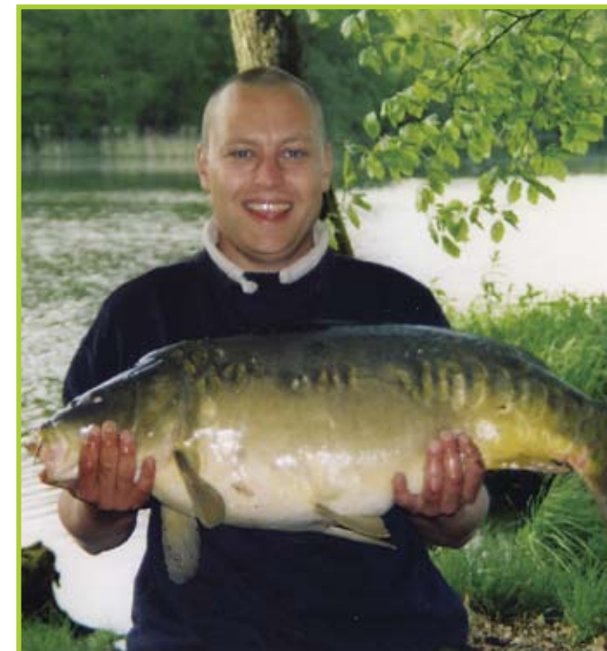
Karpe fra en mere idyllisk sø i Polen.

Jeg bruger ellers min bivvy mest når jeg tager til udlandet og fisker. Jeg har været et par gange i Holland, og nogle gange i Polen, og der bruger jeg bivvyen. Jeg er gerne afsted en hel uge og derfor er det rarest med et telt, hvor du kan lukke af for andre, og bare være dig selv.