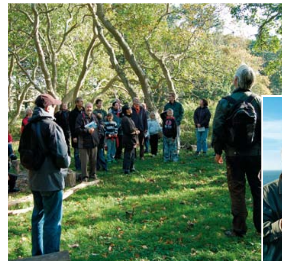
I en lille lysning kan man campere med sit telt i den danske skov. Der er også mulighed for at lave bål, og nyde en dejlig udsigt.