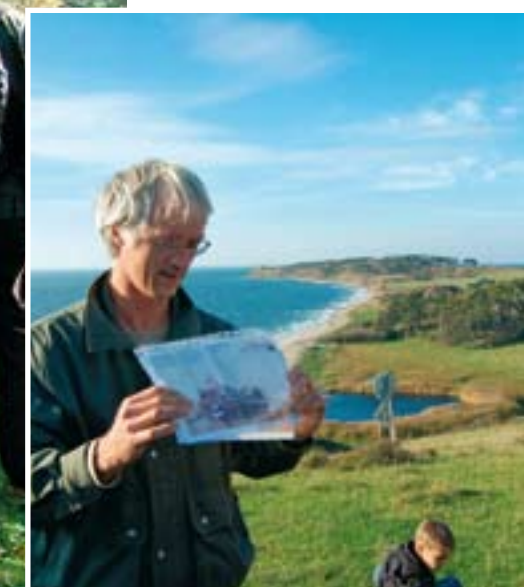
Til højre for naturvejlederen ses den lille sø, der skulle have været krigshavn i dag ser den nu fredelig og meget lidt krigerisk ud.