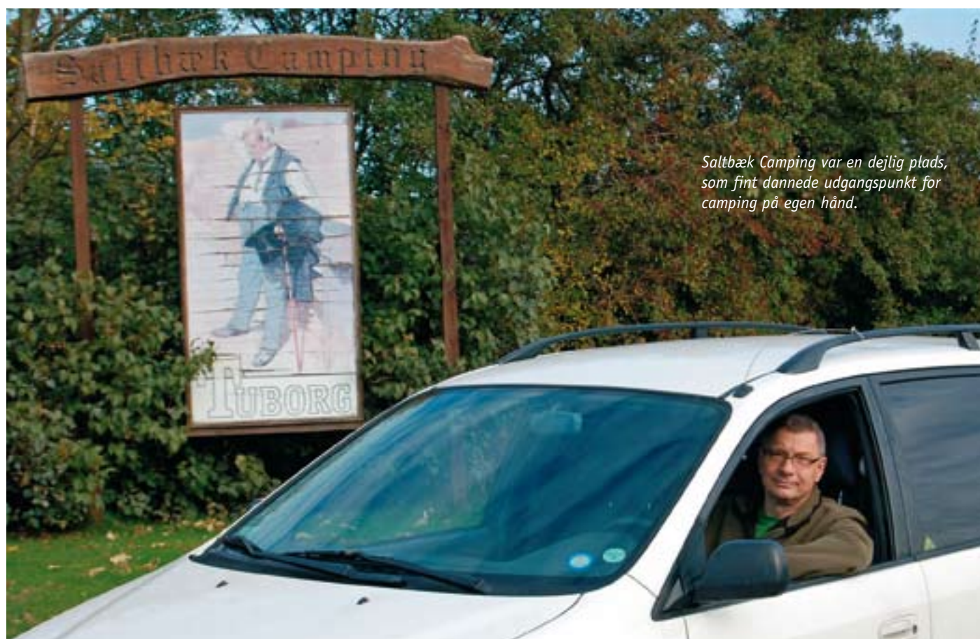
Saltbæk Camping var en dejlig plads, som fint dannede udgangspunkt for camping på egen hånd.