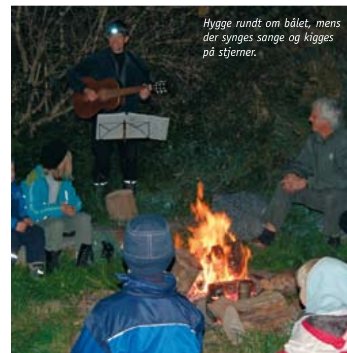
Hygge rundt om bålet, mens der synges sange og kigges på stjerner.

Med noget forarbejde hjemmefra, var arrangementerne allerede fundet. Det første der blev fundet på naturnet.dk var en aftenur, hvor planen var en stjernekeggertur medmindre det var over-skyet - ellers stod det på bål og hygge. Heldigvis viste himlen sig fra en skyklar side, og det var muligt både at se mælkevejen, den nærmeste nabogalakse Andromeda og en satellit der prøvede at udgive sig for at være et stjernesud, men vist desværre ikke helt kvalificerede sig som et. Der var også tid til hygge om bålet, sang og snobrød og rigtig god stemning.