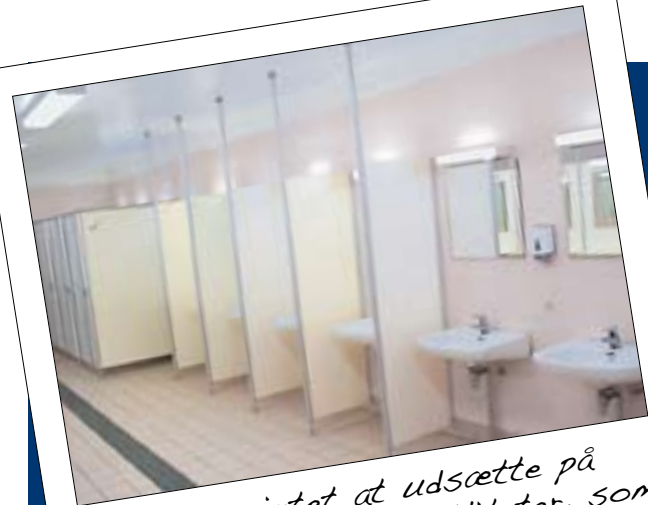
Der er intet at udsætte på pladsens sanitets faciliteter, som der findes to af på pladsen.