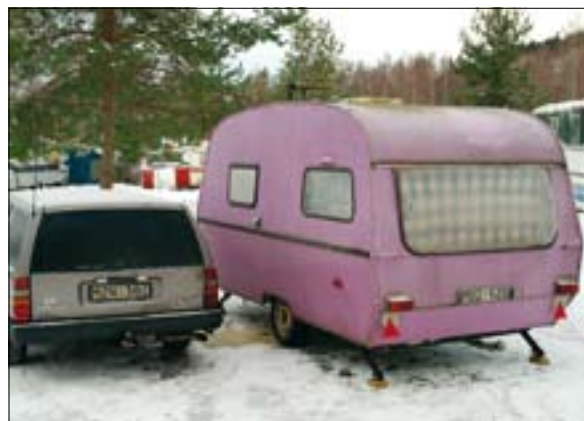
En lille beboet vogn, der indikerer der ikke er tale om en kirkegård for campingvogne.