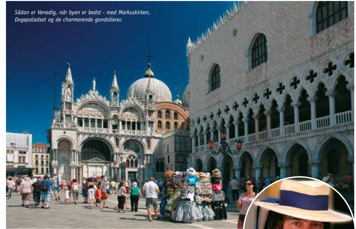
Sådan er Venedig, når byen er bedst - med Markuskirken, Dogepaladset og de charmerende gondolierer.