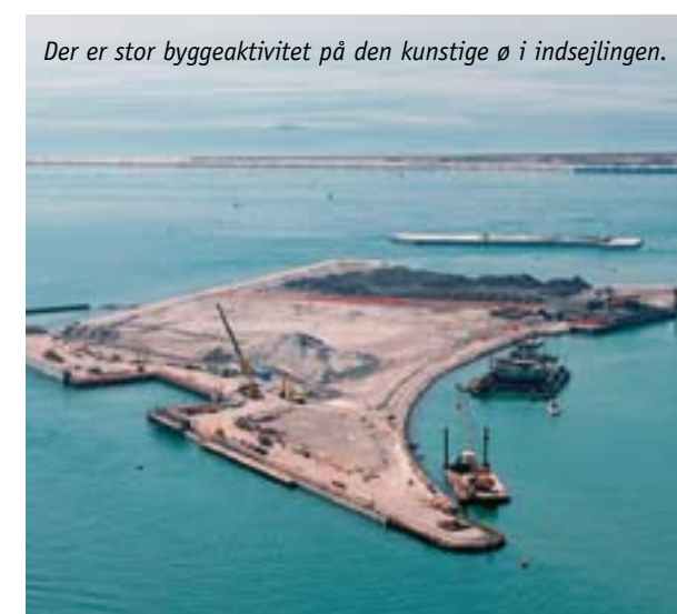
Der er stor byggeaktivitet på den kunstige ø i indsejlingen.

katastrofer. Mange venetianere husker oversvømmelserne 4. november 1966, hvor vandstanden nåede op på 194 cm over normal. Så sent som i 2002 stod vandet den 16. november 147 cm over normal vandstand.