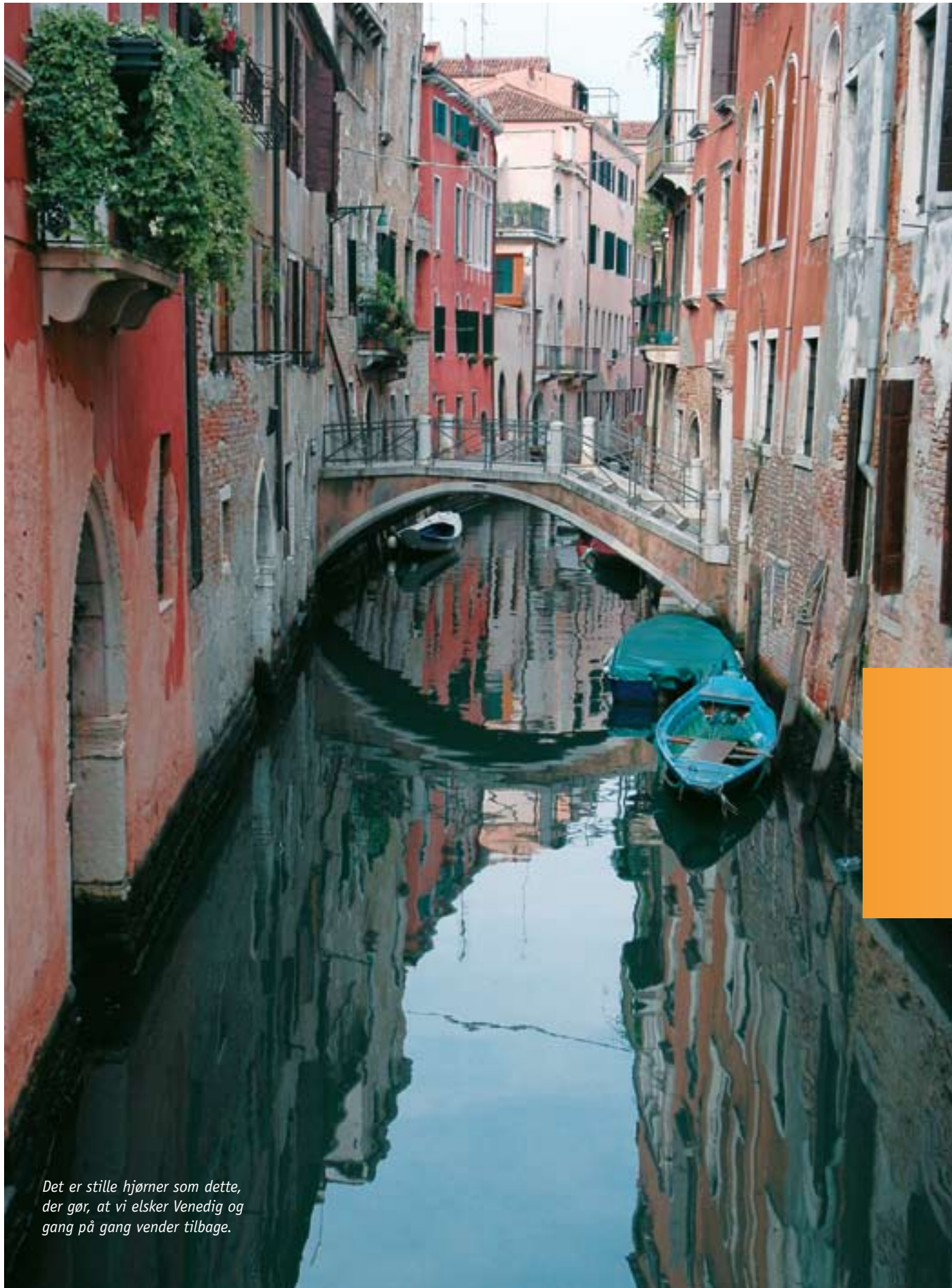
Det er stille hjørner som dette, der gør, at vi elsker Venedig og gang på gang vender tilbage.