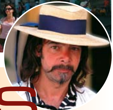
Tekst & foto: Sven Petersen