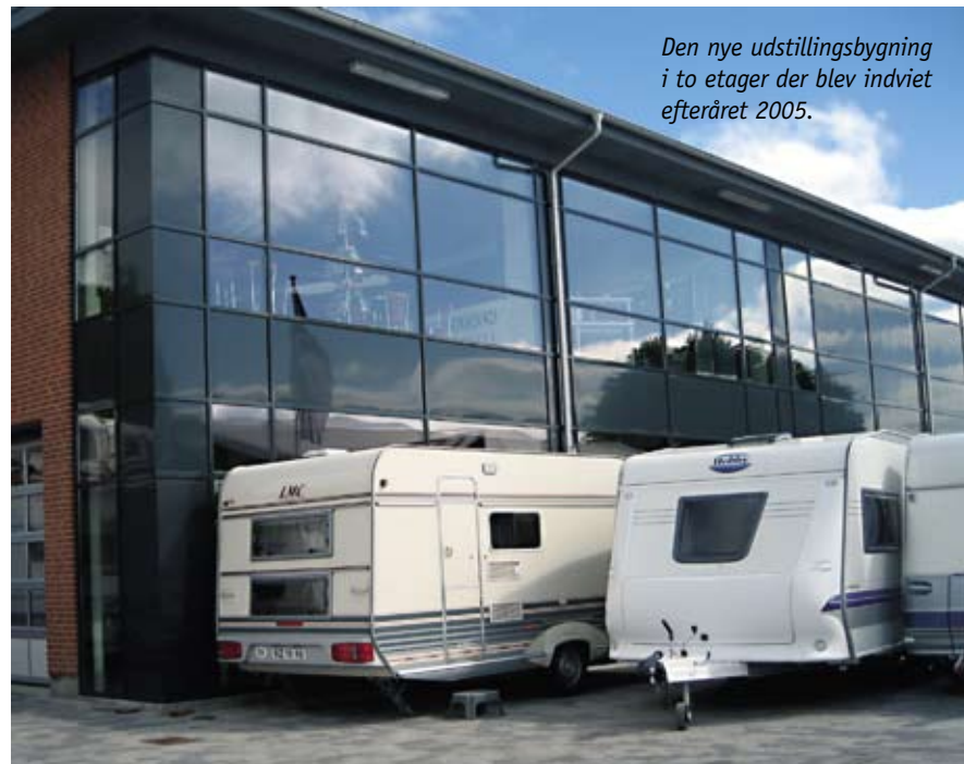
Den nye udstillingsbygning i to etager der blev indviet efteråret 2005.