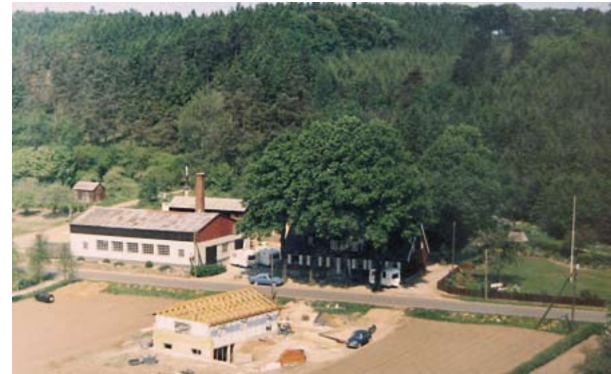
Luftfoto af Hinshøj Caravan da der blev bygget campingvogne på det tidligere savværk.

Populær Mekanik april 1968 beskriver danske og udenlandske vogne med priser.