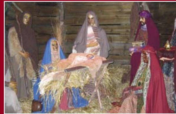
Julekrybbe som der findes flere af rundt omkring på Liseberg og i selve Göteborg.

Dette hjørne af Liseberg er opbygget som en havn.