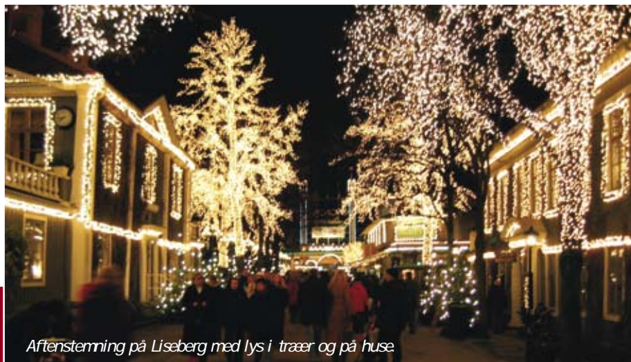
Aftenstemning på Liseberg med lys i træer og på huse.

Göteborg er en hyggelig by at besøge op til jul, med masser af julehygge, men Julemarkedet på Liseberg som starter (alle-rede) 17. november er helt specielt. Det er Nordens største julemarked og her er alt hvad hjertet kan begære. Det er et rigtig gammeldags julemarked med små boder overalt på Liseberg. Du kan købe nisser i alle afskygninger. Spise julemad, svenske pølser eller oste. Eller hvad med kunsthåndværk eller stearinlys i alle faconer og størrelser. Der findes ligeledes en samisk teltby. Der er julesange og skøjtebane. Og så er der lys oppe og nede, i træer og buske, på huse og tage - ja, alle vegne og selvfølgelig flottest om aftenen.