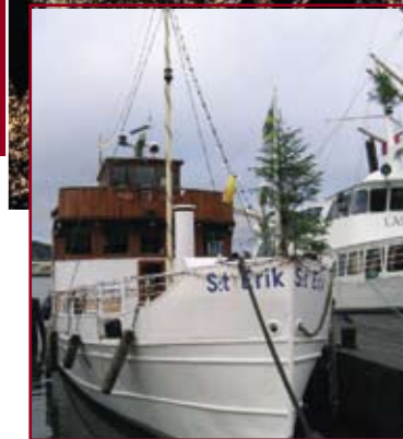
Selv turbåden der sejler i skærgården er pyntet med et juletræ i stævnen.