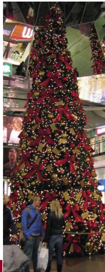
Flot pyntet juletræ i rødt og guld og med masser af lys i et af byens shoppingcentre.