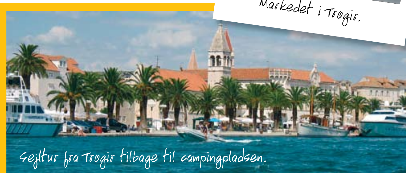
Sejltur fra Trogir tilbage til campingpladsen.