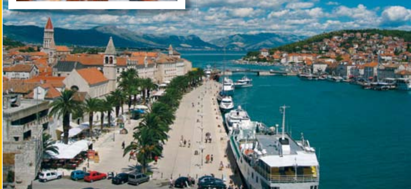
udsigt fra borgens tårn over promenaden i Trogir.

og toiletter var der nok af, og det var rent og pænt, bortset fra gulvet, der altid virkede snavset, selvom det lige var blevet vasket. Pladsen ligger på en lille halvø, og til den ene side er der klippestrand – den anden side består af små, hvide sten og vandet har den mest fantastiske turkisblå farve. Det er krystalklart, og det var en fornøjelse at bade der. Det blev hurtigt dybt, men det kan vi godt lide.