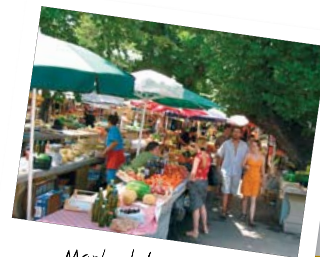
Markedet i Trogir.

Det er en smuk tur rundt om faldene. Turen tager et par timer, men der er steder, hvor man kan købe lidt at drikke, så det føles ikke slemt. Man går op langs den ene side af floden og kommer nedad igen på den anden side. Turen foregår på trapper, stier og trægangbroer. Ca. halvvejs rundt ligger der en