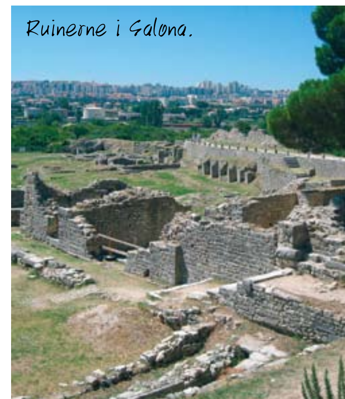
Ruinerne i Salona.