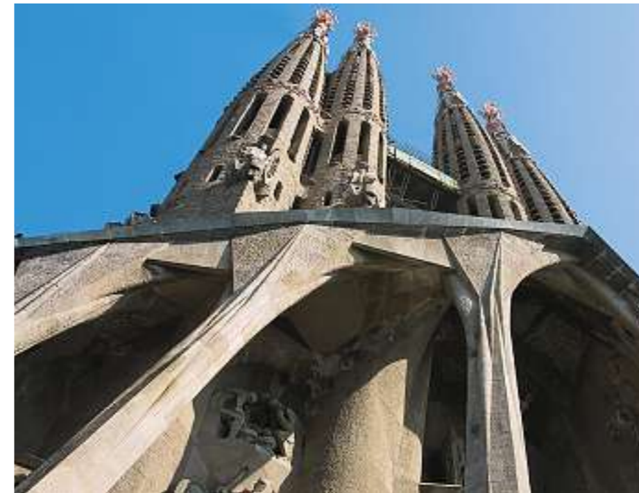
Den hellige families kirke bliver færdig om ca. 100 år.

Vi var nu mere interesserede i de gamle sten, hvoraf nogen ikke var så gamle endda. Det var dem som arkitekten Antoni Gaudi havde lagt hjerne til. En fantastisk kringlet og fantasifuld hjerne, må man nok sige. Hans huse ved indgangen til Park Güell lignede honningkagehuse fra eventyret om Hans og Grete og de fantastiske bænkerække - verdens længste - og fremstillet i glaseret keramik er et eneste eventyr. På et ret tidligt tidspunkt af sit liv fik Gaudi den idé at Barcelona skulle have en ny katedral og han startede bygningen af samme, vel vidende at det ville tage flere hundrede år. Den skulle naturligvis bygges i hans særprægede Jugend-stil. Man er langt henne i opførelsen af kirken, som nu er verdens mest besøgte byggeplads; fordi man først nu i dets indre kan begynde at skelne genialiteten i hans ideer.