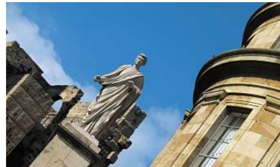
Romerske minder i Tarragona

trods advarsler fra campisterne på Vilanova - ikke husket, så vi fik reddet os en saftig forkølelse, som vi måtte døje med de næste 14 dage. For dumhed skal man straffes! Den sidste seværdighed i området finder vi i byen.