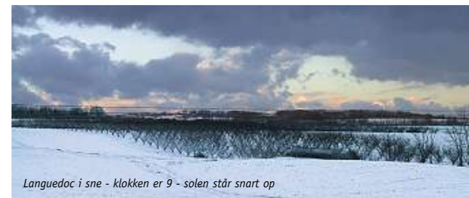
Languedoc i sne - klokken er 9 - solen står snart op

Dertil havde vi 1 lygte med neonrør og advarselsblink.