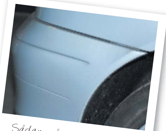
Sådan, så er den som ny.