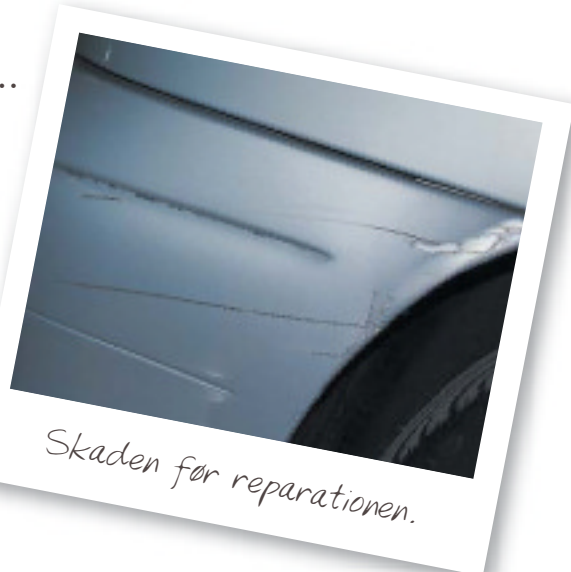
Skaden før reparationen.

Chipsaway har det hele i en varevogn, og er dermed mobile. Det eneste de kræver er et opvarmet sted at arbejde og adgang til 220 volt. Derfor arbejder de bl.a. med værksteder og større firmaer med mange firmabiler og egen garage eller lagerhal etc. Men også private kan bruge Chipsaway, da de fleste af deres afdelinger råder over eget værksted. De skader, der skal udbedres, kan som nævnt være af mange forskellige typer. Stenslag i vinduer kan også laves, men her er også flere andre aktører på markedet. Småridser m.v. poleres og lakeres ved hjælp af en airbrush-teknik, hvorved man undgår, at oplakere hele fladen. Buler og skrammer repareres og slibes inden lakering. Flænger og huller i kofangere m.v. repareres med et net, der fastgøres i kofangeren, hvorefter der spartles ud og lakeres. Tekstiler og tæpper udbedres med nye "fibre", der erstatter de oprindelige.