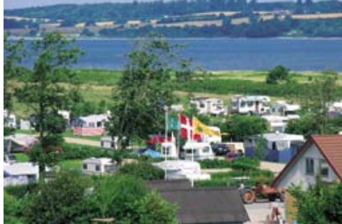
Der er havudsigt fra de fleste enheder på Gammelmark Camping.

tyske campister ikke så anmassende, som de ofte gør ved Vestkysten. Livet på campingpladserne i denne del af Jylland er derimod mere "tilbagelænet", og alle er, uanset om det er fastliggere eller nomader, venlige og hjælpsomme overfor hinanden. Udover mange tyskerne finder du også mange hollandske teltliggere. Alt sammen noget der er med til at gøre campingturen spændende og oplevelsesrig. Her er et lille udpluk, der meget godt repræsenterer de forskellige muligheder.