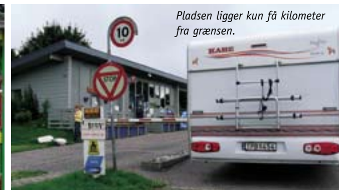
Pladsen ligger kun få kilometer fra grænsen.