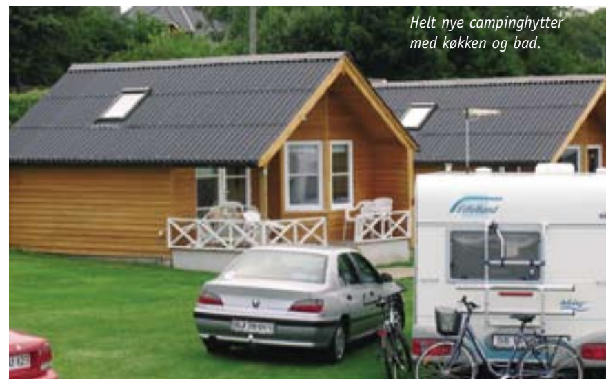
Helt nye campinghytter med køkken og bad.