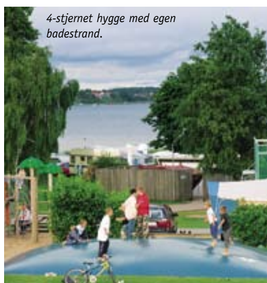
4-stjernet hygge med egen badestrand.