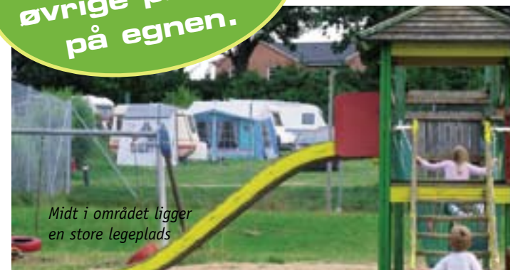
Midt i området ligger en store legeplads