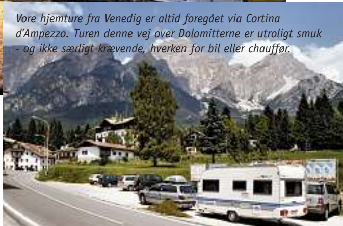
Vore hjemture fra Venedig er altid foregået via Cortina d'Ampezzo. Turen denne vej over Dolomitterne er utroligt smuk - og ikke særligt krævende, hverken for bil eller chauffør.

opleve det store karneval i februar til at gå i opfyldelse? Eller måske får vi mulighed for at se den store regatta, Regata Storica i september, hvor gondolierernes styrke og dygtighed sættes på en prøve. Sceneriet i sig selv skulle være et overdådigt orgie i farver og pragt.