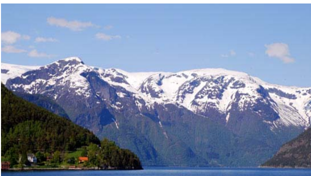
Naturen er så storslået og nydes i fulde drag under turen. Så flot, at det svært gengives på et billede.