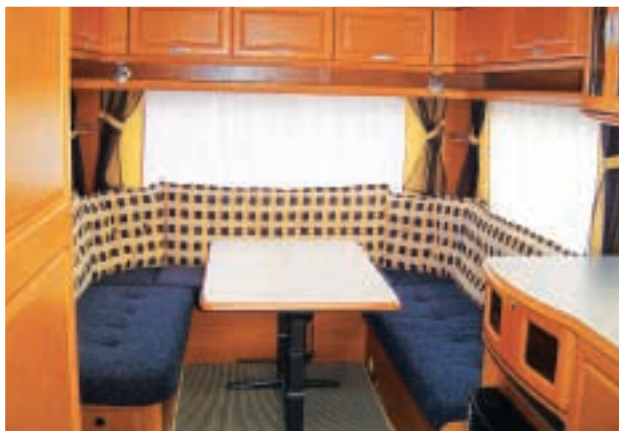
Stilfuldt interiør med mulighed for at vælge mellem tre stofvarianter.