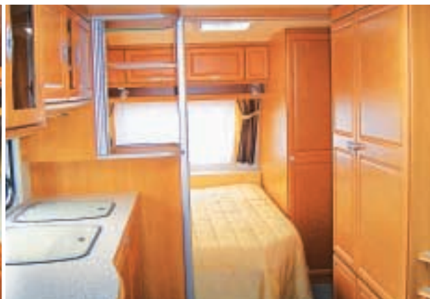
Fransk seng og hjørnetoilet.

>> fur end på bordplade – svinger mellem 500 lux og 50 lux. En så stor kontrast er uhensigtsmæssig, da det trætter øjnene – burde laves bedre.