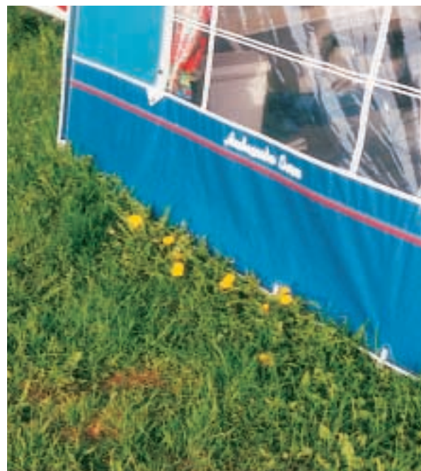
Husk, klip græskanten rundt om teltet.

Opstil teltet, så syningerne er 10-15 cm over jord, så man undgår, at syningerne rådner.