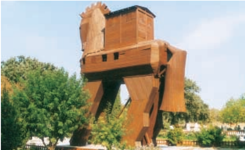
Hesten blev brugt i krigen, mellem trojanere og grækere.