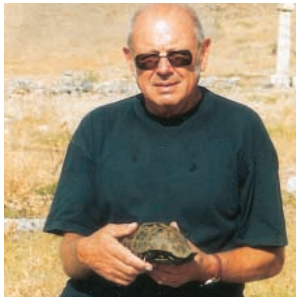
Johs. med skildpadde, der kravlede rundt mellem ruinerne.

Det havde været en noget besværlig hjemtur, gennemsnitshastigheden havde, siden vi kørte fra Grækenland, været under 50 km./t. Så vi var glade for at komme ud at køre på motorvejen til Budapest. Ved Kiskunf betalte vi 27,54 kr. Og ved Kecskemet 67,77 kr. Nu skulle vi slappe af i nogle dage i Budapest, fandt Camping Rosengarten, pris 108,21 kr.