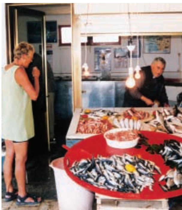
Fiskehandler ved havnen i Andramiteion.