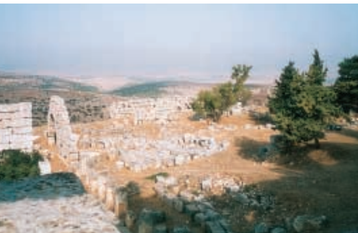
Udsigt over det syriske landskab fra Simon Søjlehelgens katedral.