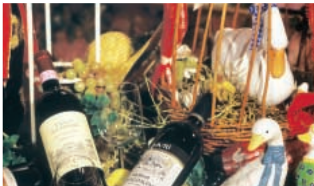
En lille detalje i udsmykningen.