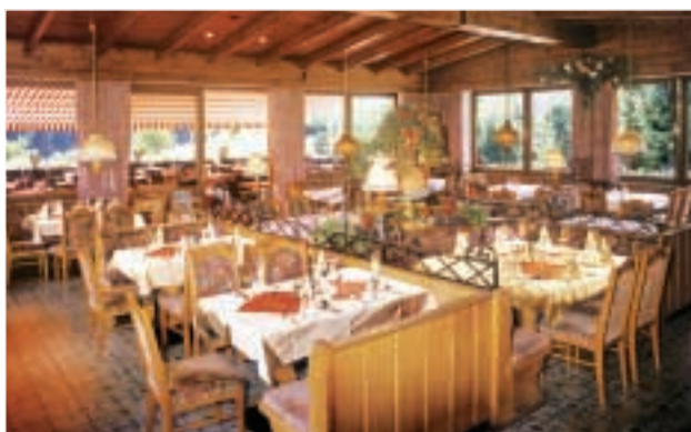
Hyggelig restauration med god mad til fornuftig pris