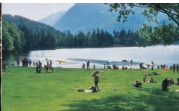
Skønne naturomgivelser ved Camping Seeblick.