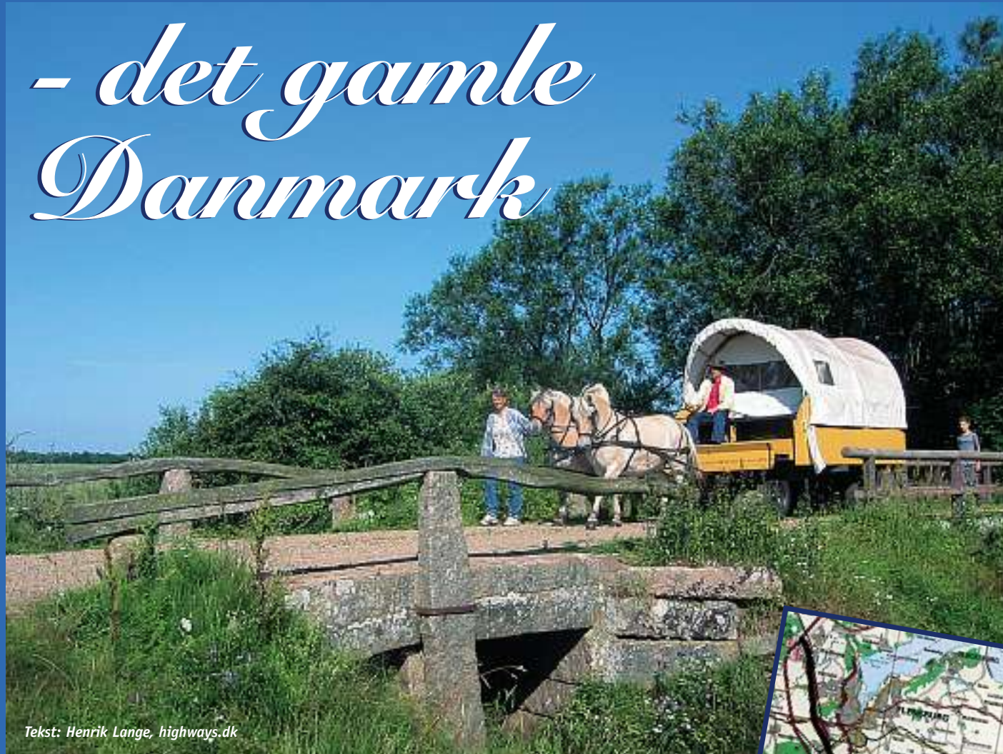
Tekst: Henrik Lange, highways.dk

Hærvejen er en af det danske riges ældste hovedfærdselsårer. I gamle dage udsprang Hærvejen i vikingebyen Hedeby syd for Slesvig i Sydslesvig, og fulgte så i store træk hovedvandsskellet hele vejen op gennem Jylland til Viborg, Jyllands daværende centrum for handel og administration.