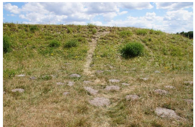
Figur 9 Vi har fået en nye sti :-)