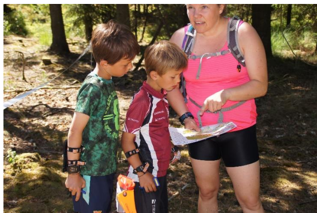
Figur 4 Vejledning inden børnene skal på en bane