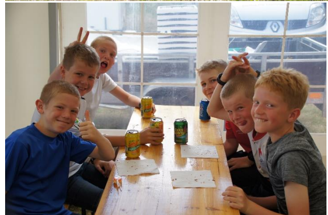
Figur 8 Super dejligt at se den brede alderssammensætning på deltagerne