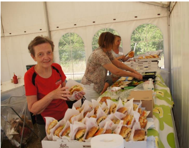
Figur 7 Cafeen fik smurt en masse Vestjysk boller – kendetegn: kød fra slagteren, boller fra bageren samt friske grønsager i bollen