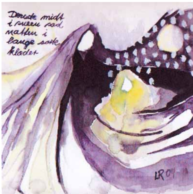
Akvarel over "Historien om en moder" af Lone Rahbek