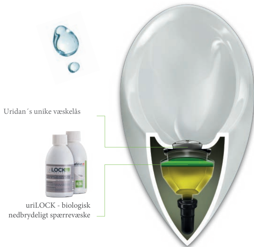
Uridan's unikke væskelås