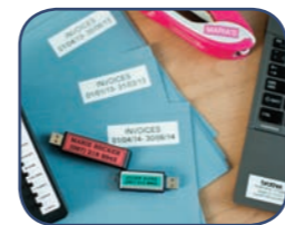
Printer labels i 3,5 - 24 mm bredde

Du kan også tilslutte til din pc eller Mac og være kreativ med forskellige fonte, stilarter, billeder og rammer på din label. Du kan endda linke til tekst i et Microsoft Excel-ark og printe mange labels ud i en fart takket være den høje printhastighed og fuldautomatiske kniv.