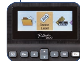
Farvedisplay med høj opløsning