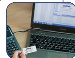
Printer labels fra din pc eller Mac