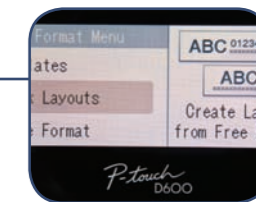
Indbyggede, redigerbare labeldesign