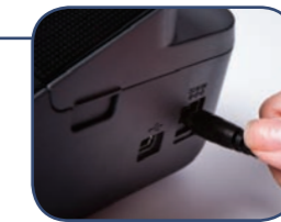
Anvender 6 x AA-batterier* eller medfølgende AC-adapter