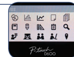
14 fonte ; 99 rammer Mere end 600 symboler