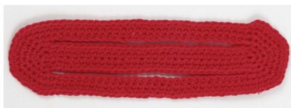
Billede af den færdige røde side