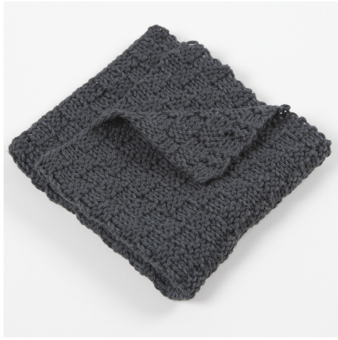
Strik i tern