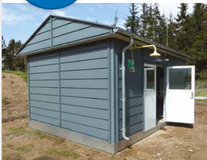
Bygning med vedligeholdelsesnem komposit klinkpladebeklædning

Pumpestationsoverbygninger fra Scan-Plast leveres i dimensioner og design samt med udstyr mv. efter kundeønske.