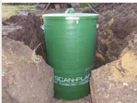
Etablering af pumpestation

Scan-Plast fører et stort program af pumpestationer til alle formål, bl.a. dræn-, kloak- og grinderpumpestationer . Pumper, ventiler, automatik mv. leveres i fabrikater og kvalitet efter kundeønske.