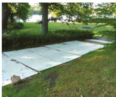
Perfekt til blød grund