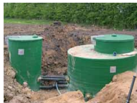
Størrelser fra Ø 400 mm til Ø 8500 mm Fremstillet i kompositmateriale, der er ca. 15 gange stærkere end PVC og PP