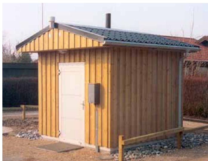
Bygning med 1 på 2 bræddebeklædning, imprægneret

Næste FORSYNINGER OG RENSEANLÆG - NYHEDSMAIL sendes 1. november 2012.