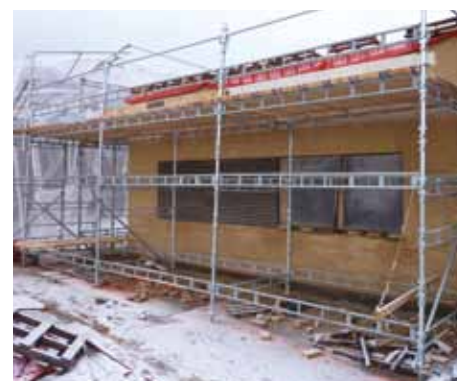
Stabilt underlag for murerstillads

Næste FORSYNINGER OG RENSEANLÆG - NYHEDSMAIL sendes 1. november 2012.