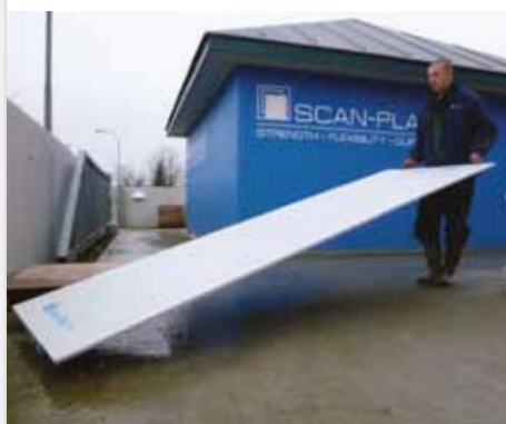
Lav vægt giver nem håndtering