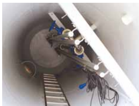
Pumpestationerne leveres komplet med pumper, ventiler og udstyr i fabrikater efter kundeønske