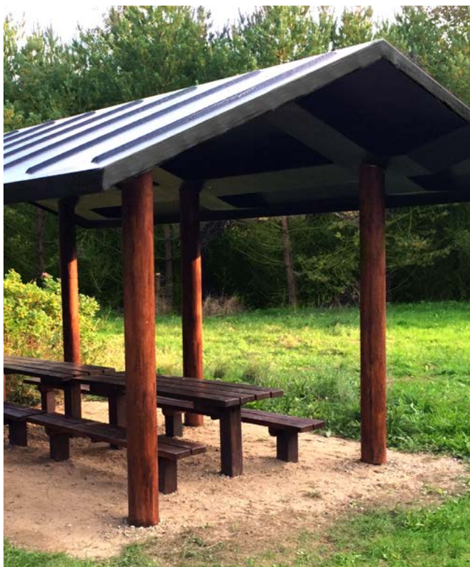
Компания Scan-Plast осуществляет изготовление под заказ.