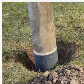
Прочная анкерная опора из композитного материала, армированного волокном.