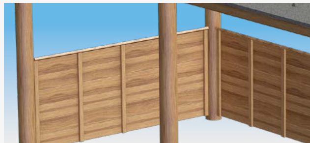
Ограждение как в половину, так и во всю высоту, обеспечивающее защиту от дождя и ветра. Можно купить как дополнительное оборудование.