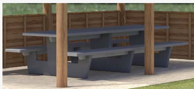
Стол и скамейки на 8 человек из композитного материала, армированного волокном. Можно приобрести в качестве дополнительного оборудования.