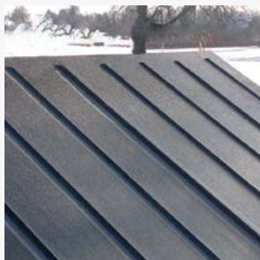
Водонепроницаемая и не требующая ухода скатная крыша из композитного материала.