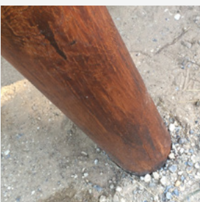
Stâlpi tratați, durabili, pentru protecție împotriva intemperiilor.