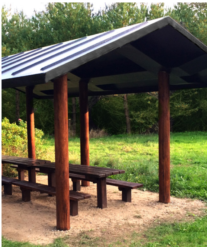
Compania Scan-Plast oferă producție la comandă.