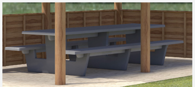
Masă și bănci din material compozit armat cu fibre pentru 8 persoane. Disponibilă ca echipament opțional.