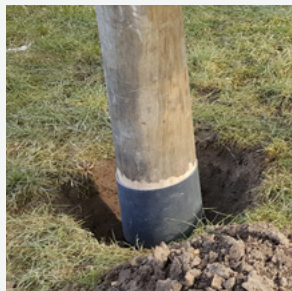
Suport durabil de ancorare din compozit armat cu fibre.