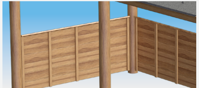
Garduri pe toată înălțimea sau la jumătatea înălțimii asigură protecție împotriva ploii și vântului. Poate fi achiziționat în calitate de accesoriu.