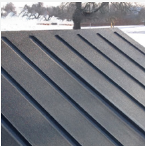
Acoperiș înclinat din compozit rezistent la apă și fără întreținere.