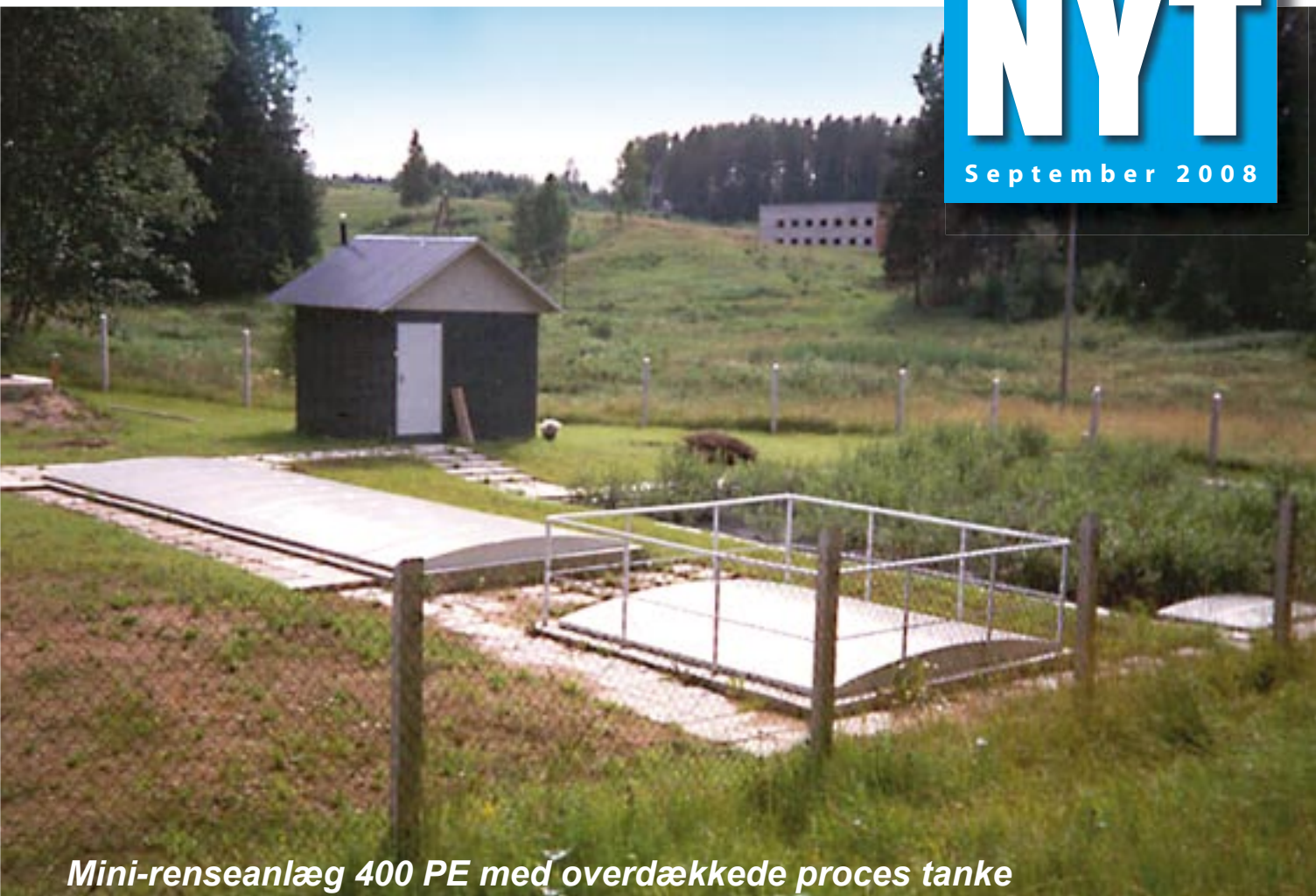
Mini-renseanlæg 400 PE med overdækkede proces tanke