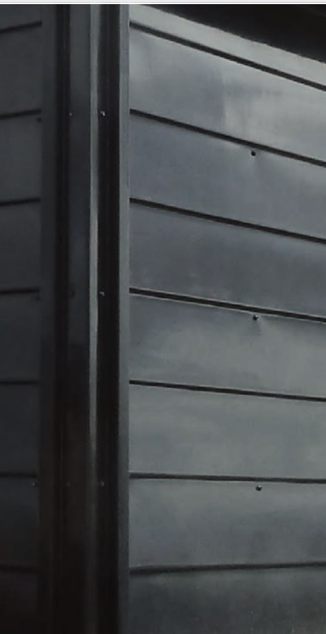
Обшивка пластинами из стеклопластика