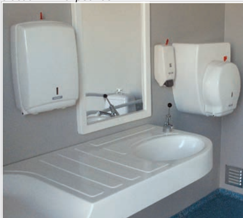
Встроенная раковина со столом для пеленания, приспособлена для людей с особыми потребностями