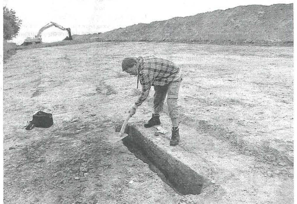
▲ Den danske muld er fortsat fuld af værdifulde sager fra vores forfædre. Det viser en opgørelse over væsentlige arkæologiske fund i 2010 fra Kulturarvsstyrelsen. Arkæologerne har fundet alt fra værdifuldt guld til store fæstningsbyggerier i det forgangne år. Især nye opdagelser ved gravhøjene og runestenene i Jelling er særdeles opsigtvækkende. I sommer var man i fuld