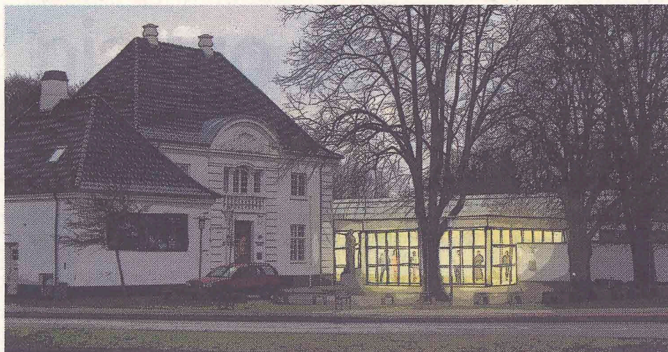
Til de første 1.000 gæster, der tager brug af tilbuddet om fri entré er der ovenikøbet gratis kaffe. Pressebillede