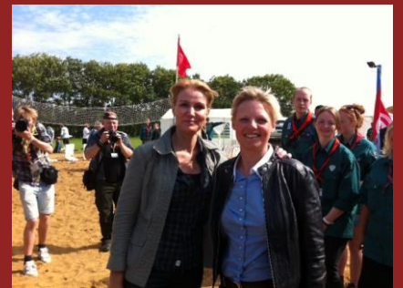
Her ses jeg med Helle Thorning Schmidt under hendes besøg på verdens største spejderslejr i Holstebro

Traditionen tro er der mange folkelige arrangementer hen over sommeren. Et af dem jeg holder særligt af er Ulfborg Marked, hvor Socialdemokraterne som sædvanligt var på pletten i uge 33. Og ligesom de forrige år, havde vi de øvrige politiske partier som naboer på markedspladsen. Det skaber en god stemning, men også godmodige politiske drillerier om, hvem, der kan farve gaden mest rød eller blå med balloner og flag.