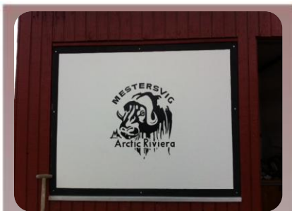
Jeg besøgte også station Metersvig i Østgrønland