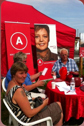
Her ses konkurrencen om "Den danske model" på Ulfborg marked