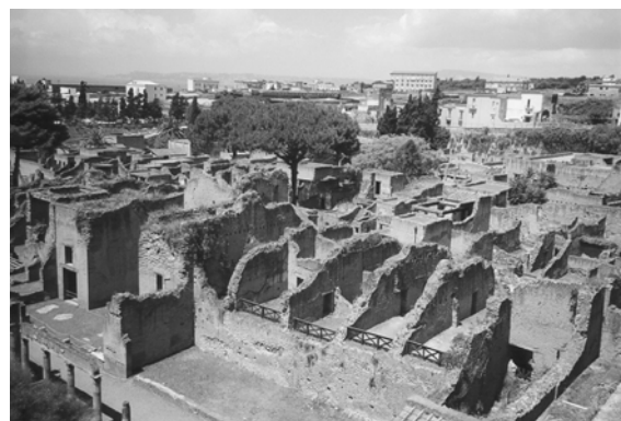
Bustur. Varighed ca. 12 timer.

Den udgravede del af byen rummer ingen officielle bygninger, hverken teatre eller templer og heller intet forum. Til gengæld er der rig lejlighed til at studere rammerne om privatlivet hos de rige romere i atriumhusene, hos middelklassen i etageejendommene og hos de jævne romere i tavernerne.