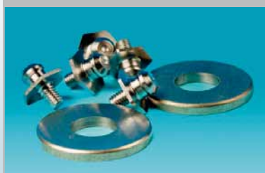
SLEBNE OG BEHANDLEDE EMNER