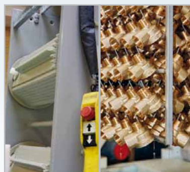
FINISH VIA GELBBRÆNDING

EV har stor erfaring med montage af sammensatte fittingsystemer og har stor succes med løsninger, som er baseret på montage af fittings eller lodning af producerede fittings sammen med kobberør. Herudover har EV Metalværk stor erfaring med tætheds- og trykprøvning af hele fittings- og ventilsystemer.