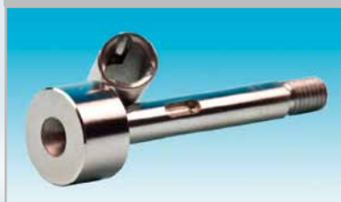
HÆRDBAR RUSTFRI STÅL