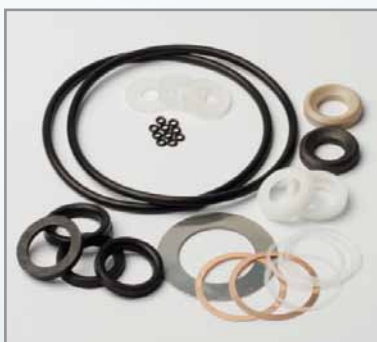
GEVIND OG PAKNINGSEKSPERTISE

EV kontakter som service kunden ved sidste afkald på rammen.