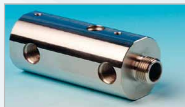
RUSTFRI SYREFAST STÅL