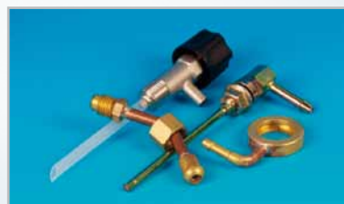
VARMBUK OG LODNING

EV har med en varieret maskinpark mulighed for at tilbyde særlige løsninger, hvor rørbugning, lodning og stansning indgår.