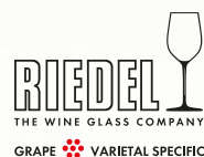
VERITAS COCKTAILGLAS 985074