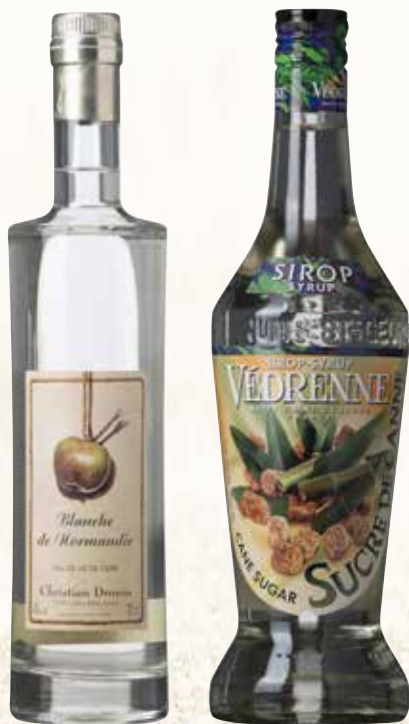
DROUIN BLANCHE DE NORMANDIE CHRISTIAN DROUIN 25161609

Shakes kraftigt og serveres i cocktailglas